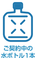
ご契約中の 水ボトル1本