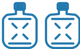
ご契約中の 水ボトル2本

キャップシール60枚で「ご契約中の水ボトル2本」をプレゼント。 40枚コースよりも最大でシール20枚お得になるコースです。