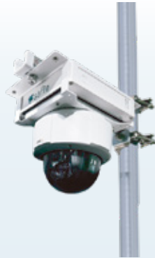
Safie GO PTZ

180度の広角レンズ、音声マイク、 夜間赤外線撮影が可能。耐衝撃等級 最高クラス (IK10) で郵送や移動 にも適しています。