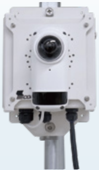
Safie GO 180

利用場所や利用目的によりカメラを選択いただけます。 180度広角カメラとパン・チルト・ズーム (PTZ) カメラまで