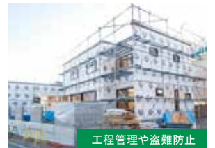
工程管理や盗難防止