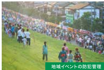
地域イベントの防犯管理