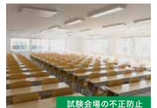
試験会場の不正防止