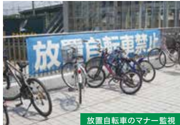
放置自転車のマナー監視